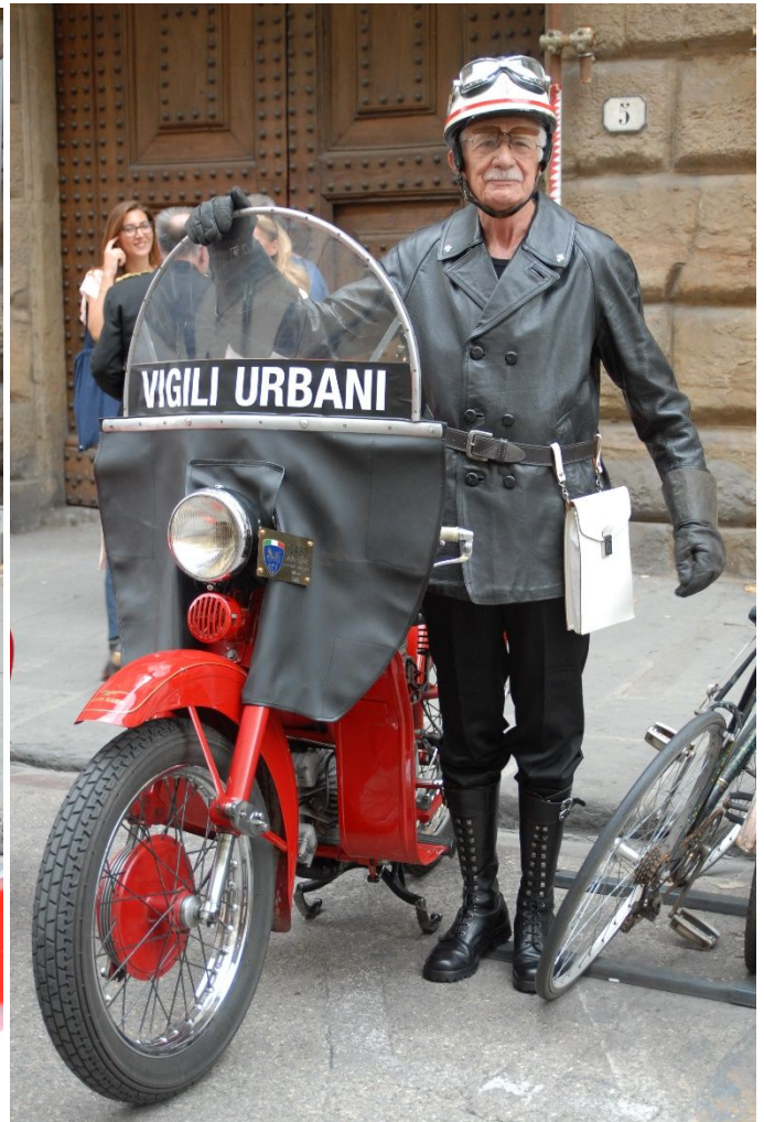
L'ingresso della mostra non poteva essere presidiato che da due Vigili Urbani di Firenze . . . rigidamente d'epoca con due diverse divise: una da servizio di città e l'altra da percorrenza stradale