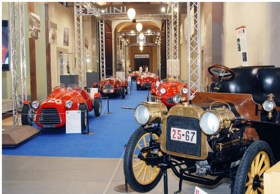
Sbirciando attraverso la piccola porta era possibile pregustare l'incomparabile spettacolo di cui avremmo goduto all'interno