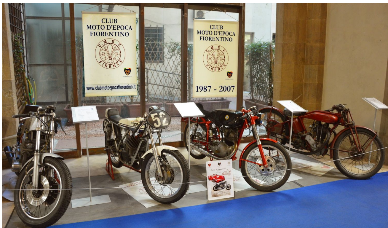
Le belle moto del CMEF