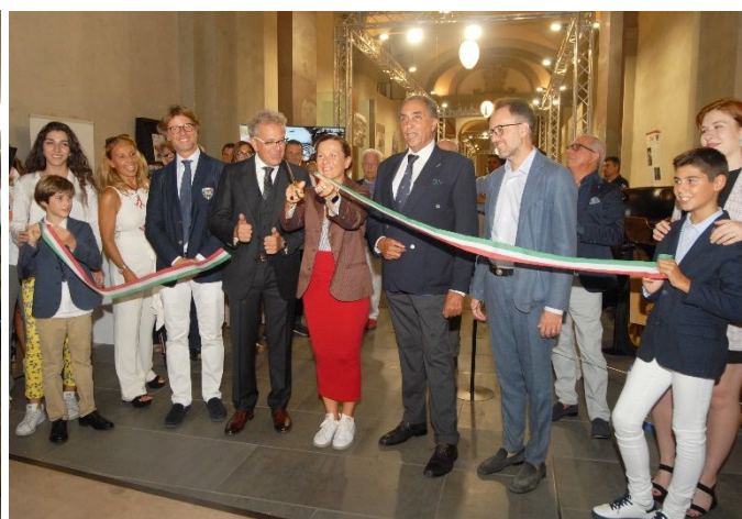
Pubblico e giornalisti affollati all'esterno in attesa . . . dell'inaugurazione con le autorità cittadine e dell'ASI