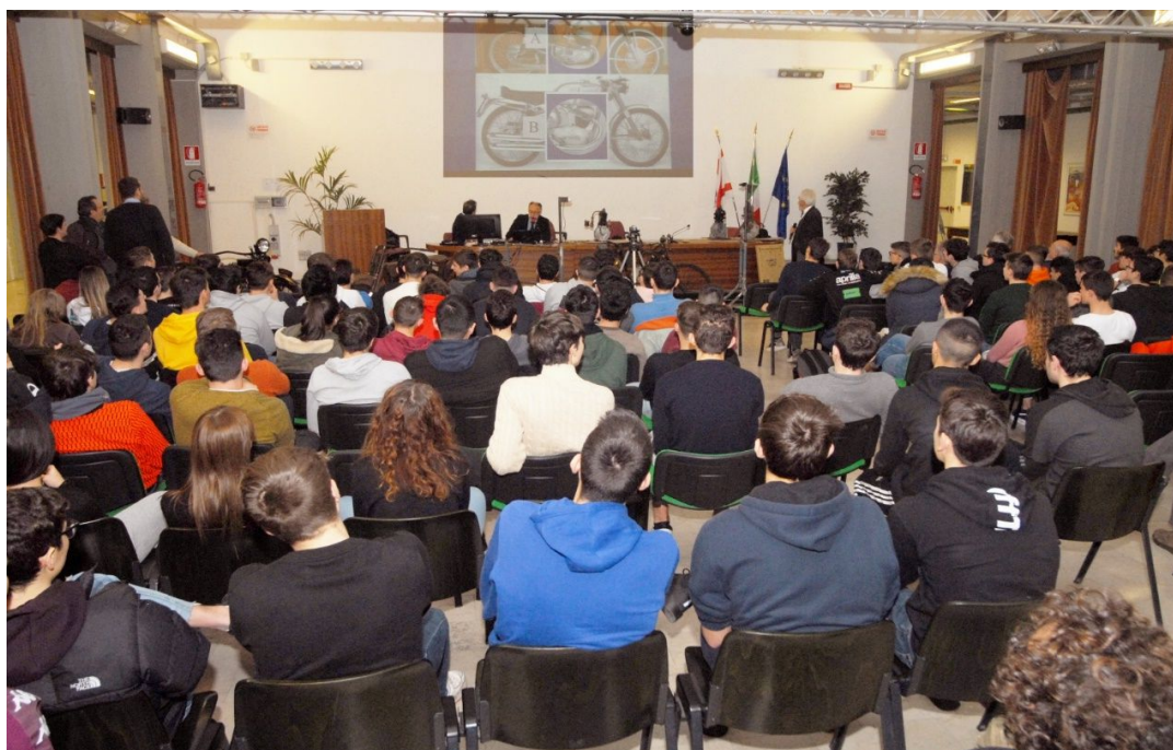
Piena partecipazione al seminario ed al dibattito da parte dei giovani allievi dell'ITIS Buzzi